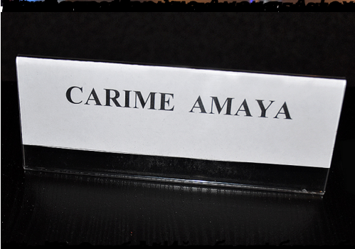
Кариме Амая, танцовщица из английской