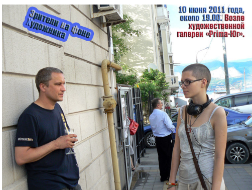
10 июня 2011 года, около 19.00. Возле художественной галереи «Prima-Yu».