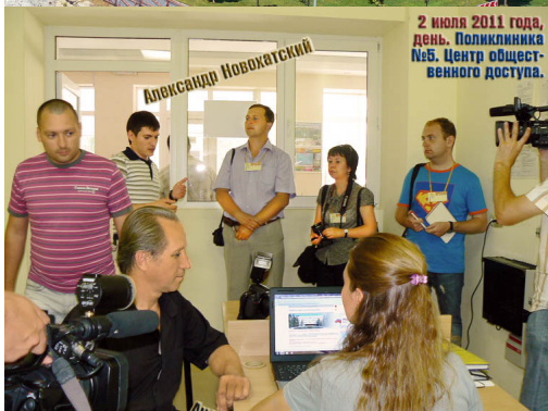
2 июля 2011 года, день. Полклинника №5. Центр общественного доступа.