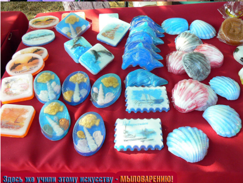
Здесь же учили этому искусству - МЫЛОВАРЕНИЮ!