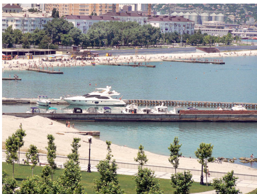
Вид из окна гостиницы «Новороссийск», где прошла презентация основных программных продуктов компании Билайн. Видны центральный пляж и яхт-клуб «Фусков море»

03.07.2011 05:33