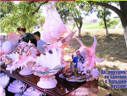
Да, ракушки, но сделано с большим вкусом!