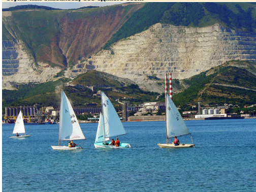
2 июля 2011 года, ближе к вечеру. Цемесская бухта. Парусная регата «Морской Узел-2011».