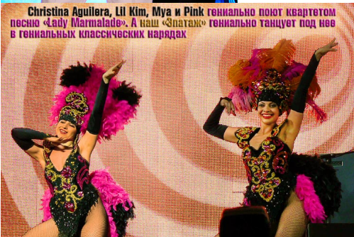
Christina Aguilera, Lil Kim, Mya и Pink гениально поют квартетом песню «Lady Marmalade». А наш «Эпатаж» гениально танцует под нее в гениальных классических нарядах