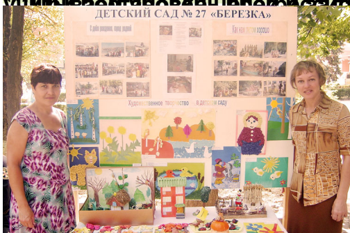
Участие в Дне Новороссийского района

*** Родители детей участвовали в выставке детских работ, категории,