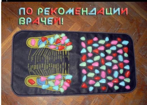
МДОУ № 27 Берёзка. Для профилактики плоскостопия и профилактики заболеваний стоп, рекомендованными стали следующие