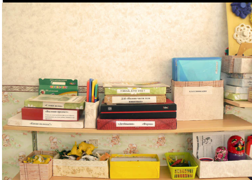
МДОУ № 27