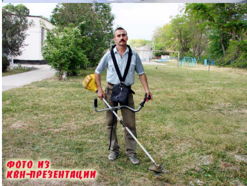
ФОТО ИЗ КВН-ПРЕЗЕНТАЦИИ