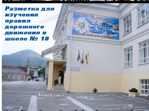
Разметка для изучения правил дорожного движения в школе № 18