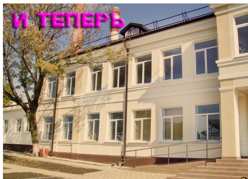
Муниципальное общеобразовательное учреждение «Центр развития образования» г. Новороссийска Парад первоклассников