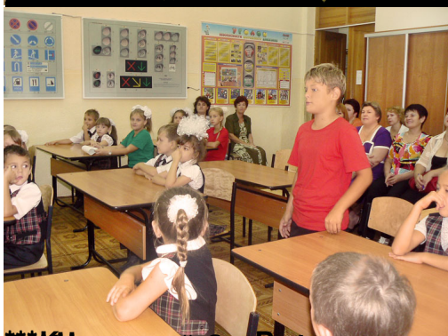
Какие красивые девочки! Как интересно проходят уроки в первом классе!