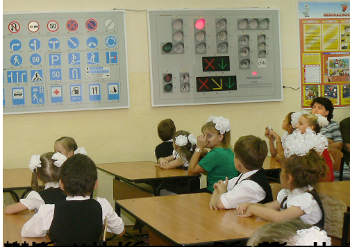
Какие красивые девочки! Как интересно проходят уроки в первом классе!