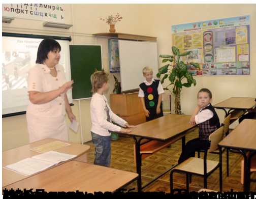
Как интересно проходят уроки в первом классе! Как