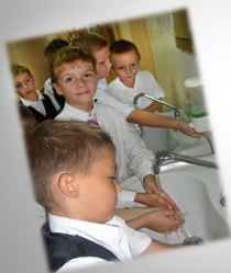
График питания учащихся

Питание осуществляется на трёх переменах: 9.15. – 9.30. 1а; 2а,б; 3а,б 10.10. – 10.30. 4а,б;5а, 6а,7а,8б 11.10. – 11.30. 8а;9а,б; 10а, 11а