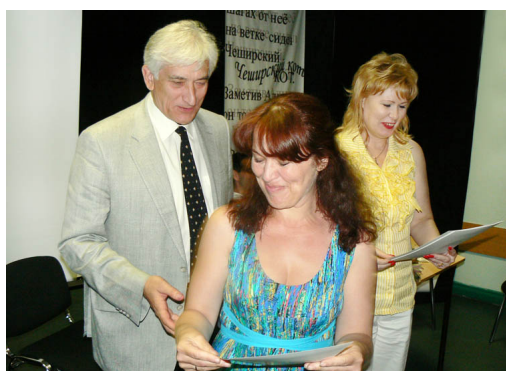
Некоторые ребята после тестирования ушли, и сертификаты, подтверждающие высокие результаты, получали за них счастливые родители.

***- У нас два студенческих кампуса – для взрослых и для несовершеннолетних. Оба – современные городки с комплексной системой охраны, контролем воспитания. Подчеркну, что многие наши студенты без особых проблем получают швейцарское гражданство, так как для несовершеннолетних год проживания считается за два.