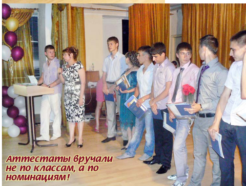
Аттестаты вручали не по классам, а по номинациям!