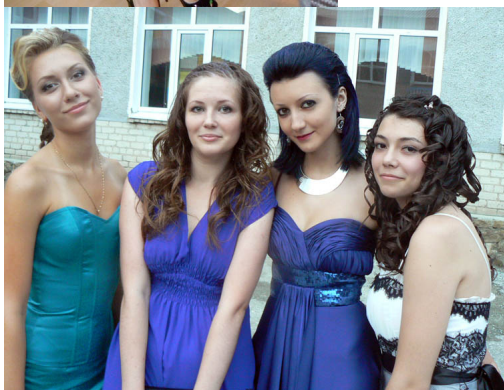
Родители поздравляли детей и речами,