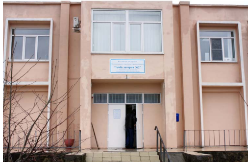
В планах - потратить на ремонт амбулатории в этом году не менее 100 тысяч рублей.

*** - 400 тыс. рублей на благоустройство улиц Тополиная - Цветочная (район соединения улиц общей площадью 600 кв.м.);