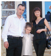
Жена Наталья и дочь Аля с нетерпением ждут возвращения капитана.

***- Обратите внимание: нападение было совершено на танкер, который вез нефть в Китай, - подчеркивает Овчинский. - Если проанализировать все пиратские захваты в прошлом году, то выясняется, что чуть ли не в каждом третьем случае бандиты нападали на суда, которые направлялись именно в Поднебесную или везли что-то для китайских компаний, работающих на африканском континенте. Очевидно, пираты действуют по заказу транснациональных мафиозных структур и, вполне вероятно, даже по заказу спецслужб некоторых стран. Берутся голодные, бездомные мальчишки 14-16 лет. В лагерях, расположенных в Сомали и других африканских странах, их обучают обращению с автоматом и гранатометом. А дальше - на лодки и вперед! И этот людской ресурс бесконечен.