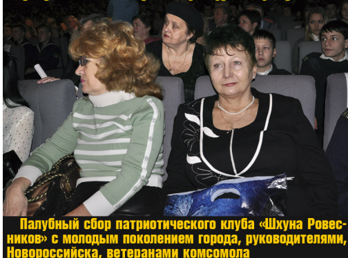
Палубный сбор патриотического клуба «Шхуна Ровесников» с молодым поколением города, руководителями, Новороссийска, ветеранами комсомола