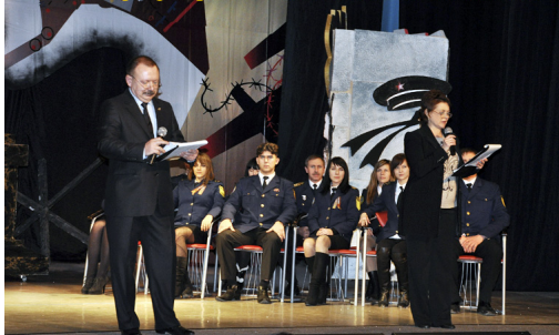
8 февраля 2013 г. Морской культурный центр