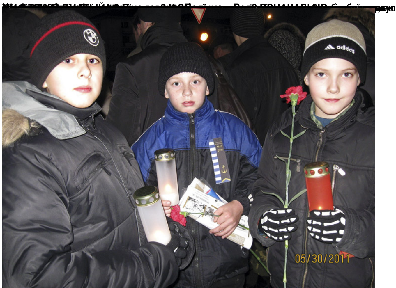
Гости "Бескозырки-2011". Учащиеся СШ №39 г.Петро- заводска (Республика Карелия).

Автор: Владимир ДАРКИН, главный редактор "НОВОРОССИЙСКИХ ИЗВЕСТИЙ" 03.02.2012 09:17