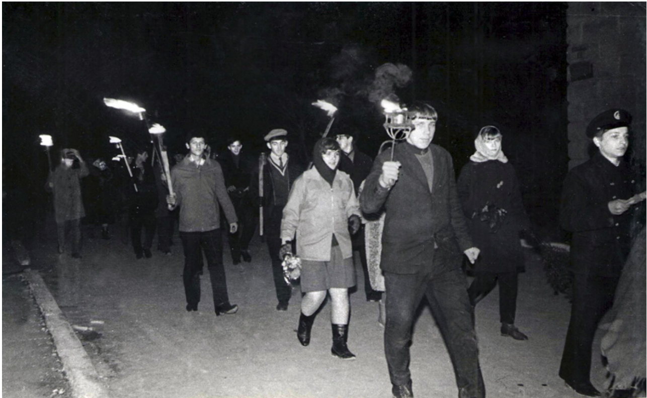
По пути на Малую землю.

Автор: Владимир ДАРКИН, главный редактор "НОВОРОССИЙСКИХ ИЗВЕСТИЙ" 03.02.2012 09:17