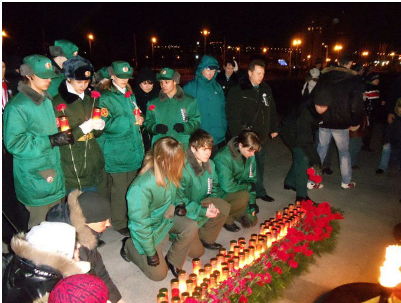
Гирлянда Славы - к мемориалу на Малой земле.