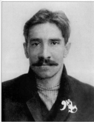
А.С. Гриневский. Петербург. 8 января 1906 г. Полицейская карточка. Государственный архив Российской Федерации (Москва). Самая ранняя из известных фотографий писателя.