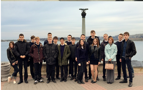
На фото: поездка в Севастополь