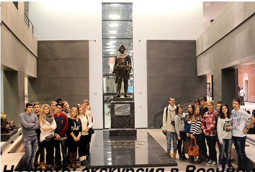
На фото: коллектив в Военно-морской музей, г.Санкт-Петербург