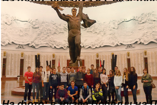
На фото: в музее Победы на Поклонной горе, г.Москва