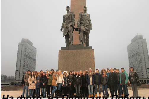
На фото: на Площади Победы, г.Санкт-Петербург