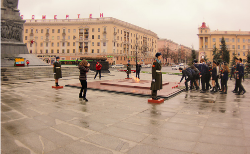
На фото: возложение цветов на Площади Победы, г.Минск