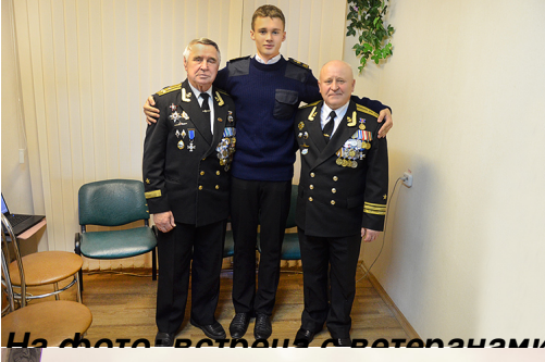
На фото: встреча с ветеранами, г.Минск