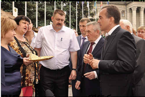
Кубанская ярмарка сельского туризма в Краснодаре впервые прошла в формате выставочного мероприятия.