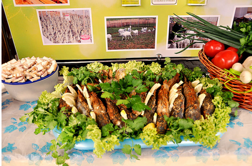
Рыбка, сало и лучок. А за кадром - коньячок...