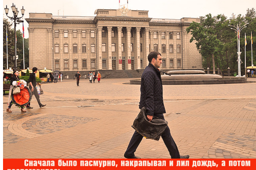
Сначала было пасмурно, накрапывал и лил дождь, а потом распогодилось...