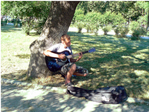
23 июня 2011 года, около 17.00. Музыкальные светотени в сквере им. Чайковского.

Автор: Текст и фото: Марина ЭКСТЕР 23.06.2011 21:53