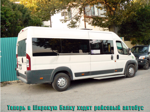
Теперь в Широкую Балку ходит рейсовый автобус