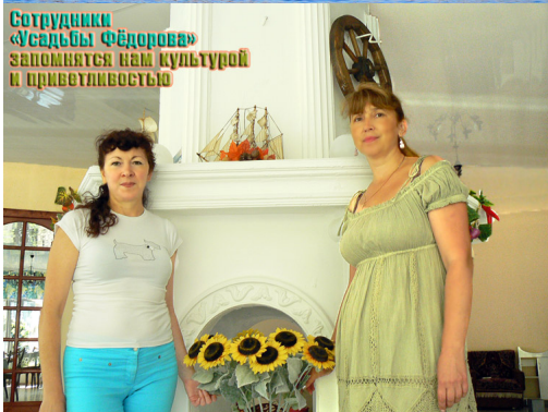
Сотрудники «Усадьбы Федорова» запомнятся вам культурой и приветливостью