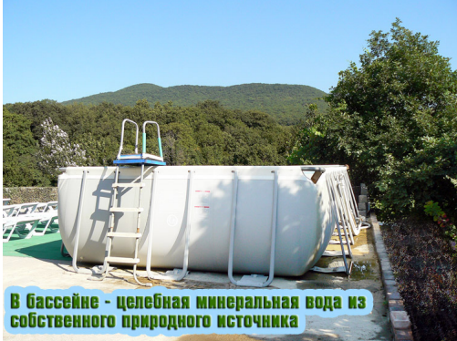
В бассейне - целебная минеральная вода из собственного природного источника