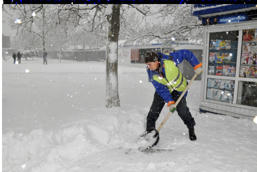
Анапское шоссе. Уборка на грани фантастики