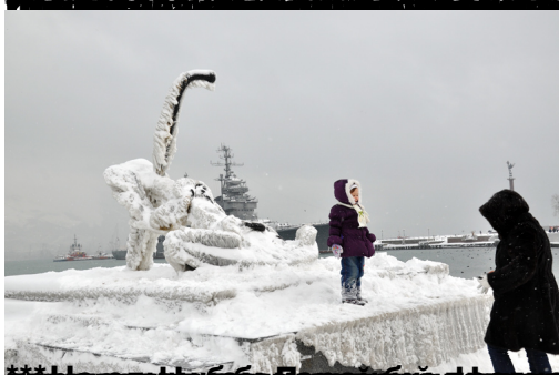
В Новороссийске в День зимних видов спорта на набережной установлен памятник скорпиону. В этот день в городе ожидается снег.