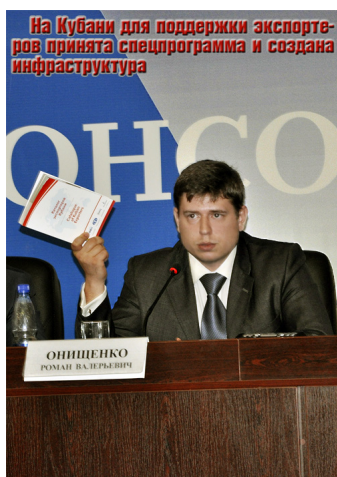
Одна из структур инфраструктуры поддержки бизнеса

Автор: Минимум текста и максимум фото: Марина ЭКСТЕР 13.04.2012 22:45