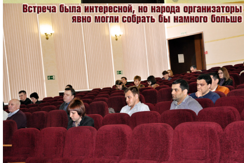
Встреча была интересной, но народа организаторы явно могли собрать бы намного больше