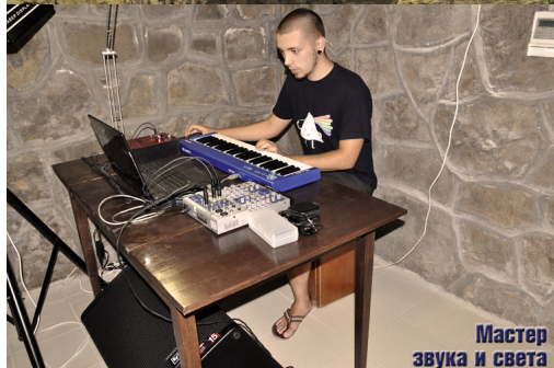
Мастер звука и света