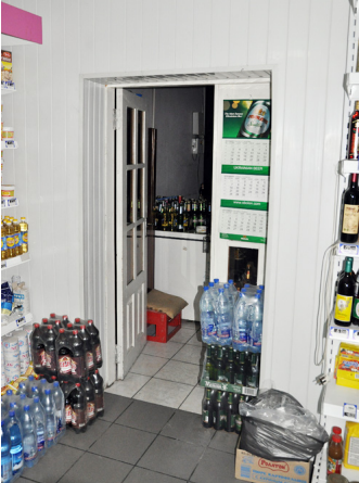
Завидев фотоаппарат, продавец быстренько скрылась в подсобке

Автор: Текст и фото: Марина ЭКСТЕР, Юлия КОНДРАТЬЕВА 02.09.2012 09:12