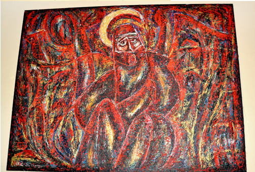
Мхитар Асланян «Где нефть, там и война»