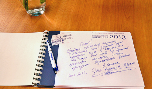
***Посвящение в стихах (п.Бадяжко), (п.Соволосов), (п.Беловский), (п.Савельев), (п.Медведев), (п.Савельев), (п.Валитов), (п.Аленин), (п.Савельев)