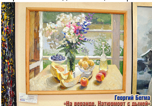
Георгий Бегма «На веранде. Натюрморт с дыней»

Автор: Текст: директор Государственного бюджетного учреждения культуры Краснодарского края «НОВОРОССИЙСКИЙ ИСТОРИЧЕСКИЙ МУЗЕЙ-ЗАПОВЕДНИК» Лариса КОЛБАСИНА, фото, заголовок, первый и последний абзацы: Марина ЭКСТЕР