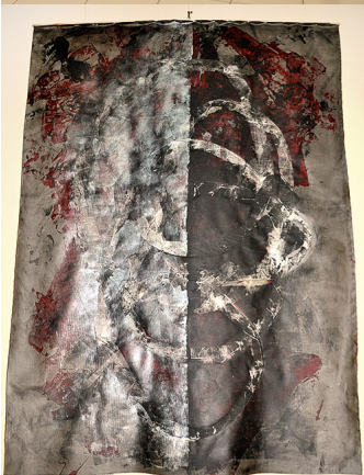
Галина Хайлу Из серии "Гравитация"