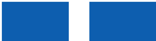
Флаг Греции, действующий с 15 марта 1922 по 22 декабря 1978