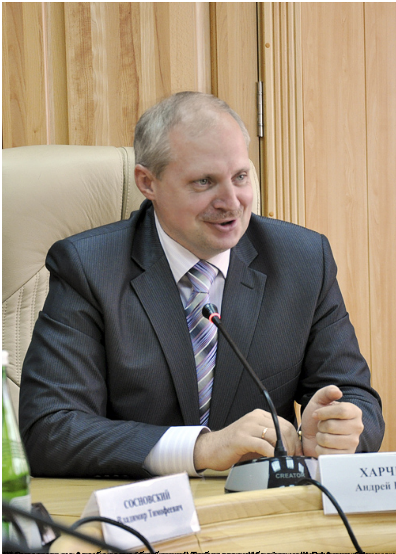
01/06/2019 15:58 с