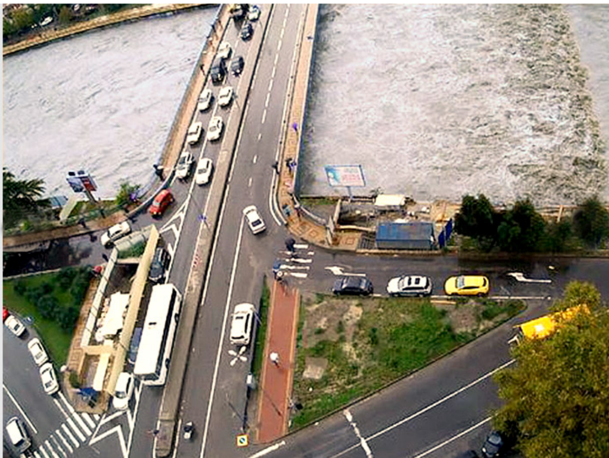
Уровень воды в реке Сочи поднялся до критического: до паркетов осталось 20 см, а до Подвесного моста - меньше метра