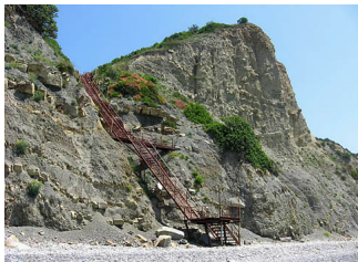
На популярный пляж ведет опасная лестница...

Автор: Старший помощник Азово-Черноморского межрайонного природоохранного прокурора юрист 2 класса А.И. ГУНИН 19.11.2010 01:02