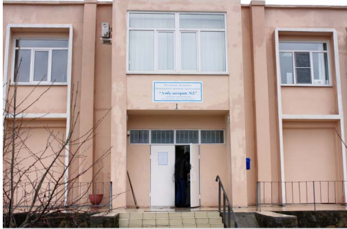
В планах - потратить на ремонт амбулатории в этом году не менее 100 тысяч рублей.

*** - 400 тыс. рублей на благоустройство улиц Тополиная - Цветочная (район соединения улиц общей площадью 600 кв.м.);