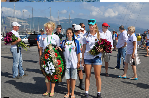
Перед возложением цветом на площади Героев