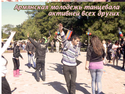
Армянская молодежь танцевала активней всех других