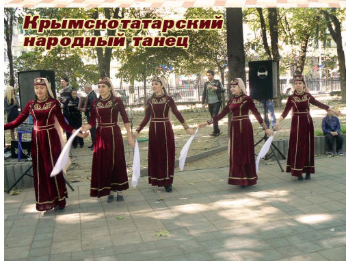
Крымско-татарский народный танец