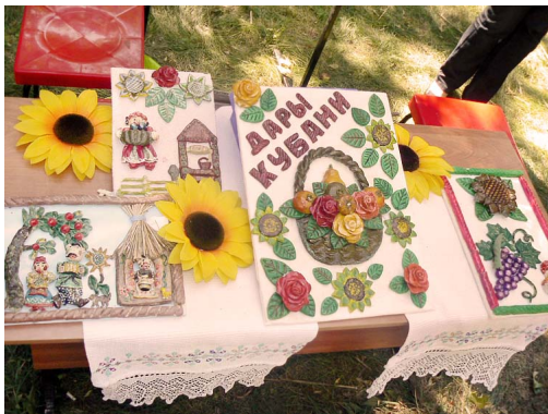
ЗНАМЕНИТАЯ УКРАИНСКАЯ КУХНЯ

11.09.2010 19:59