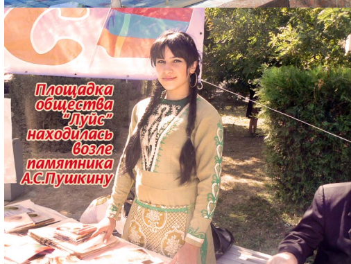
Площадка общества "Луис" находилась возле памятника А.С.Пушкину