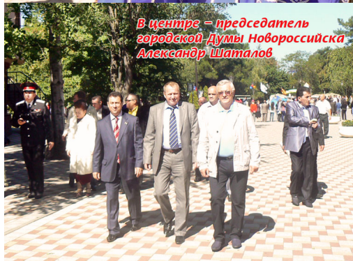
В центре – председатель городской Думы Новороссийска Александр Шаталов