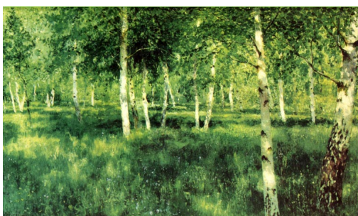
И. Левитан "Берёзовая роща"

*** Все дошколята - почемучки. Любознательность является их естественным качеством и основным побуждающим средством познания окружающего мира. От взрослых требуется только не подавить эту любознательность, а, наоборот, развивать ее, находить наиболее доступные для детей-дошкольников средства познания окружающего мира.