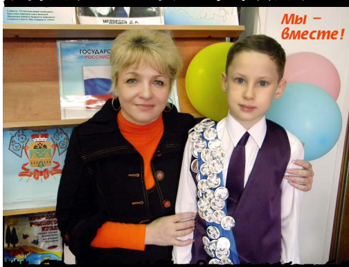
Мы - вместе!