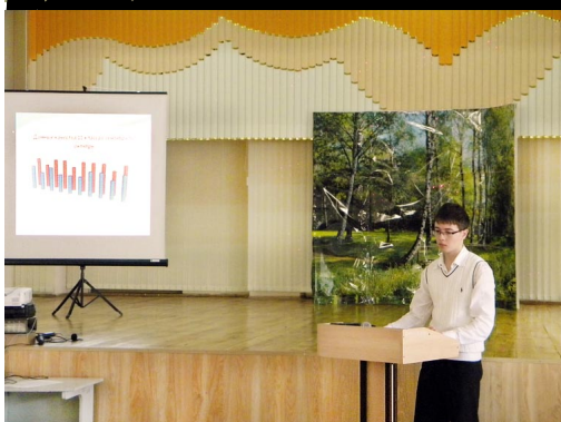
XII научно-практическая конференция "Поиск. Гипотезы. Факты" в ГОУ СПО "Новороссийский социально-педагогический колледж", 2010 год.