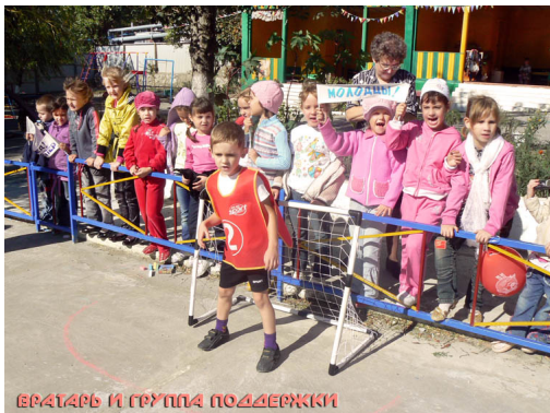
Вратарь и группа поддержки

*** На открытии площадки мальчишки сыграли в футбол, а девчонки в «кто быстрее передаст мяч». Футболисты команд «Звезда» и «Динамит» заработали медали, а все дети вообще, включая зрителей, получили конфеты. Слова в нашем фоторепортаже не очень нужны. Вы всё увидите сами на фотографиях. Когда дети увлечены и радуются, это всегда видно невооруженным глазом.