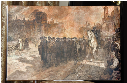
А.А. Чечин. Последний парад фашистов в Берлине. 1980

Автор: Текст и фото: Марина ЭКСТЕР 16.04.2013 23:32