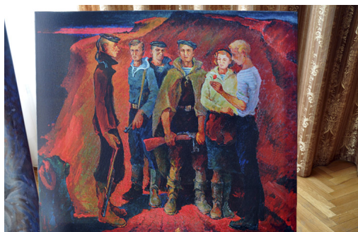
А.Н. Шинкаренко. "Юнги 43-го. Огненная Малая Земля. Новороссийск". 2005

Автор: Текст и фото: Марина ЭКСТЕР 16.04.2013 23:32