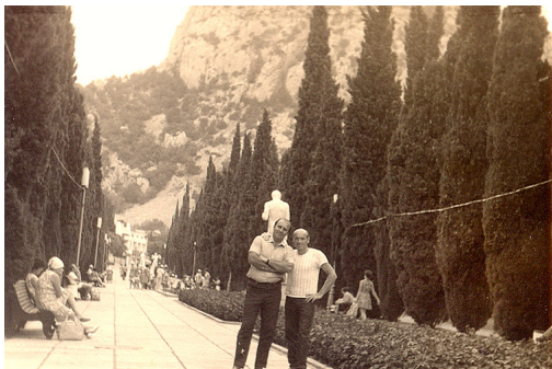
Отдых в Алупке, 1975 год.