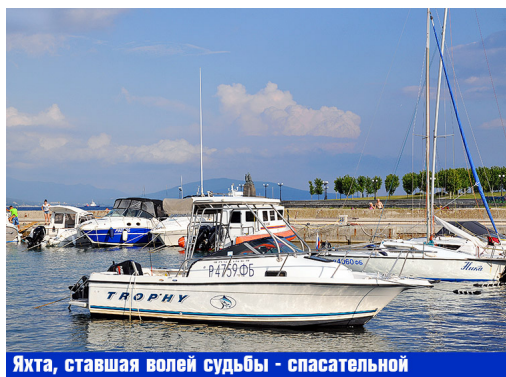
Яхта, ставшая волей судьбы - спасательной

*** Когда читаешь о громких автомобильных авариях, нередко задумываешься вот о чем. ДТП всегда имеет первопричину: ошибку водителя – рискованный обгон, неосмотрительный поворот, превышение скорости или же, например, отказ техники, отвратительное состояние дороги. Тут, конечно, есть доля случайности, но не меньше и неизбежности, неотвратимости, расплаты. А вот в момент самой аварии роль случая вырастает почти до 100%. Последствия столкновения машин, падения с обрыва, «общения» с опорой электропередач предсказать невозможно. Иногда кто-то чудесно спасается, хотя машина всмятку. Порой, увы, погибают все. Не повезло, и точка. Как говорится, у смерти свои расчеты.