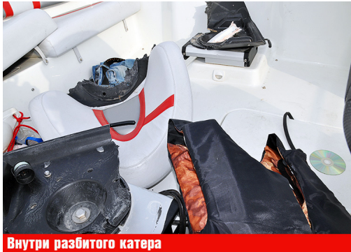
Внутри разбитого катера

конечно, так. Но сейчас и вы, читатели, знаете, что число погибших в субботней морской аварии могло быть намного больше. Погибнуть могли абсолютно все. Слава Богу, такого не случилось. Тут, кстати, и о причинах можно поговорить.