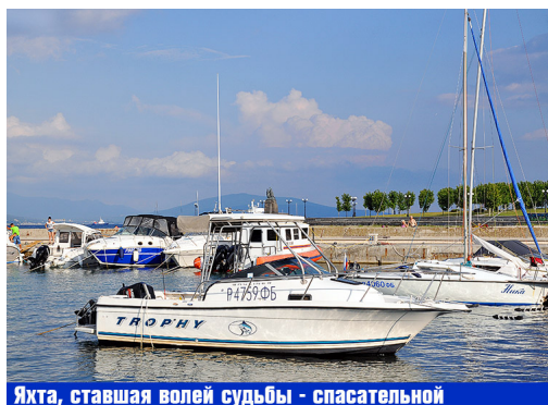
Яхта, ставшая волей судьбы - спасательной