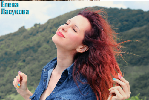
Для студии макияжа