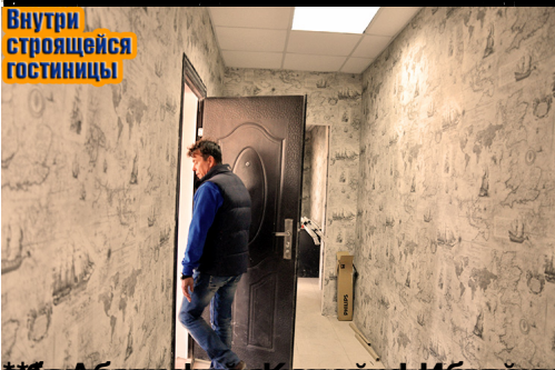
Внутри строящейся гостиницы