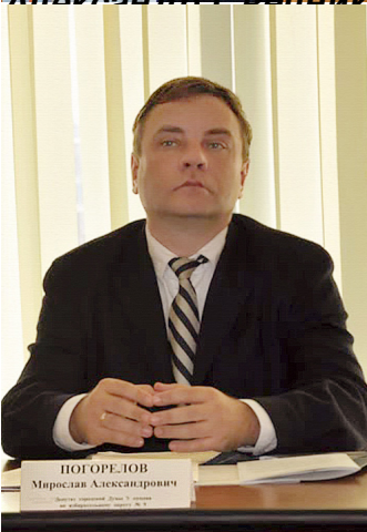
Миростяв Погорелов депутат городской Думы Новороссийска