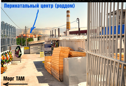
Перинатальный центр (роддом)