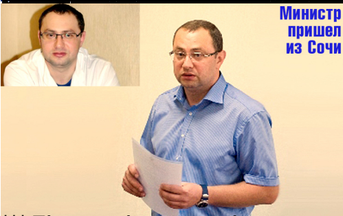
Министр пришел из Сочи