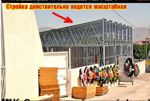
Стройка действительно ведется масштабная