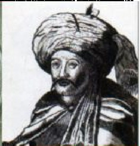
Шахин Герей хан 1777 – 1782 1782 – 1783