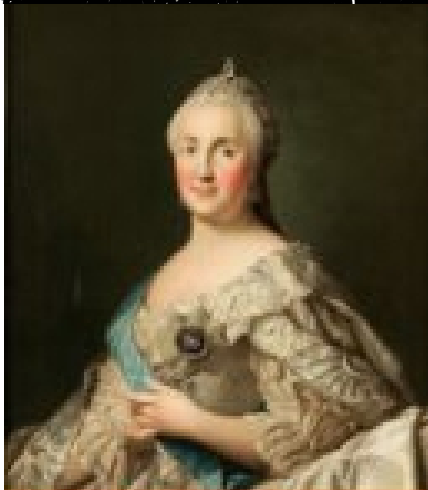
Екатерина II императрица 1762 – 1796