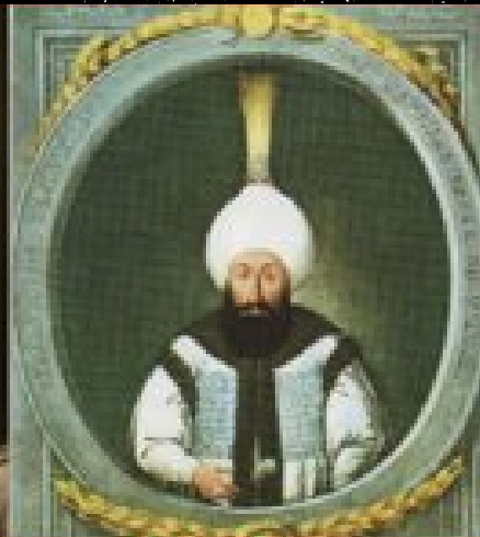
Абдул-Хамид I султан 1774 – 1789