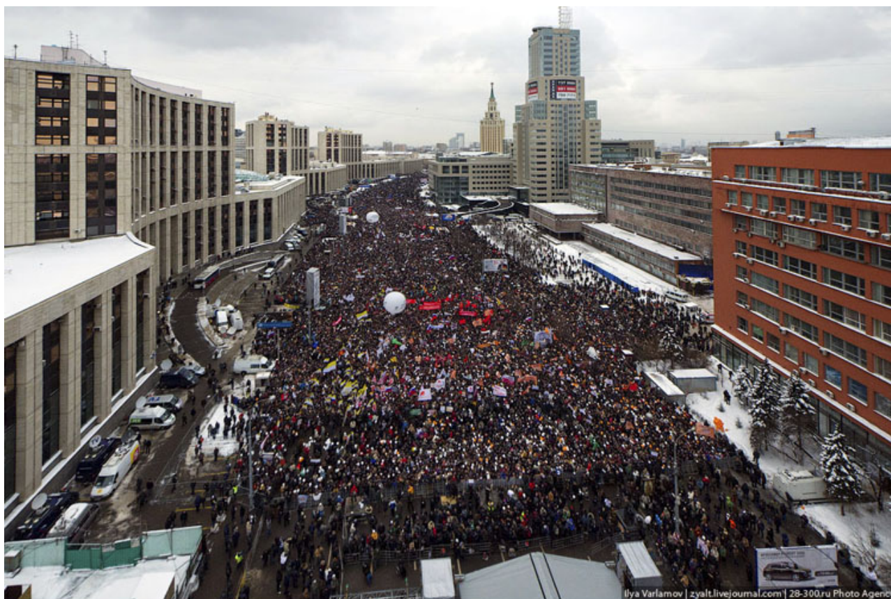
24.12.2011 года. Москва, проспект Сахарова. Митинг «За честные выборы».

*** Неожиданно для властей российский народ не стал мириться, как раньше, с массовыми фальсификациями на выборах. Пока бурлит, в основном, Москва. Причем, маргиналов в рядах тех, кто выходит на массовые митинги, мало. И только "рукой Америки" всё это не объяснить. В Интернете предостаточно ресурсов, где каждый желающий может увидеть прямые репортажи, интервью, круглые столы и т.п. своими глазами. Даже Михаил Горбачев в свои 81 режет правду-матку и говорит весьма разумные вещи. И всё, похоже, только начинается...